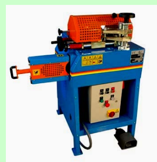
MAXI 100 + TR 120

Rua da Premolde-41, Edifício Montigoma, Z.I. do Pau Queimado Afonsoeiro, Apartado 273 2874-908 MONTIJO – PORTUGAL Tel.: +351 212 326 960 – Fax.: +351 212 326 965 Site: www.montequipa.pt – e-mail: geral@montequipa.pt